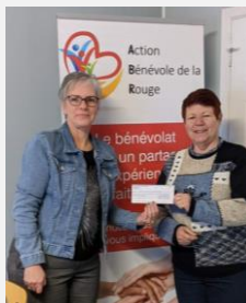
L'équipe Carrefour Jeunesse Desjardins

En décembre 2022, 170 familles ont reçu des paniers de Noël: 218 adultes et 116 enfants pour un total de 334 personnes