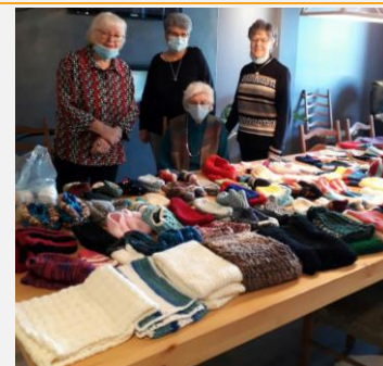
Les dames (tricoteuses) Résidence au Coeur d'Or