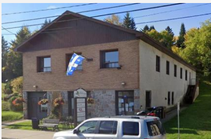
Bâtiment situé au 259, rue de l'Annonciation Sud

Ainsi, nous aurons la possibilité d'augmenter notre achalandage donc avoir plus de revenus afin d'offrir à moindre coût des articles aux plus démunis et permettre aux clients qui ont une conscience environnementale de donner une 2 e vie aux objets et de mieux consommer.